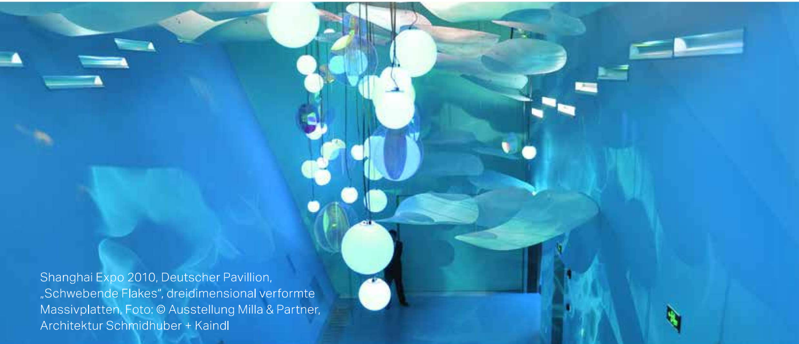
Shanghai Expo 2010, Deutscher Pavillion, „Schwebende Flakes“, dreidimensional verformte Massivplatten. Foto: © Ausstellung Milla & Partner, Architektur Schmidhuber + Kaindl